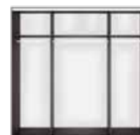
korpus szafy SZF/230 wys./szer./gt. 240/230,5/62cm