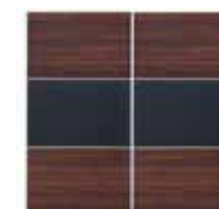
front do korpusu SZF/250 FRN/250