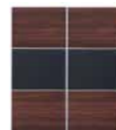
front do korpusu SZF/200 FRN/200