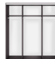
korpus szafy SZF/200 wys./szer./gt. 240/200,5/62cm