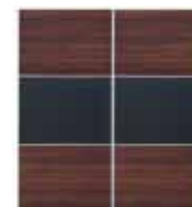
front do korpusu SZF/230 FRN/230