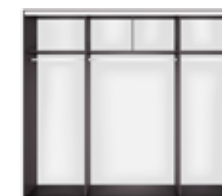
korpus szafy SZF/250 wys./szer./gt. 240/250,5/62cm