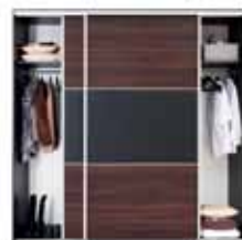
wnętrze szafy F19 SZF/230 FRN/230