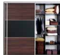
wnętrze szafy F19 SZF/250 FRN/250