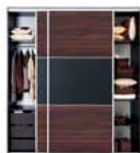
wnętrze szafy F19 SZF/200 FRN/200